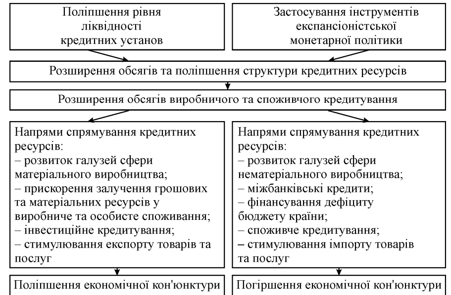
Рис. 3. Варіанти формування каналу банківського кредитування монетарного трансмісійного механізму

монетарної політики центрального банку не зміною величини процентної ставки за депозитами і кредитами, а зміною обсягів кредитування. Розширення можливостей кредитних установ внаслідок зміни структури і спрямованості кредитних відносин призводить до збільшення обсягів виробничого та споживчого кредитування. Як наслідок, в економічних суб'єктів розширюються можливості щодо залучення додаткових ресурсів, що призводить до збільшення обсягів інвестиційних та споживчих витрат. За цих умов формування ефективного каналу банківського кредитування можливе лише в межах позитивного кредитного циклу. Якщо в країні з тих або інших причин формуються ознаки негативного кредитного циклу, то розширення обсягів кредитних ресурсів може призвести до формування неоптимальних структурних пропорцій, прискорення динаміки інфляційних процесів, девальвації національної валюти тощо (рис. 3).