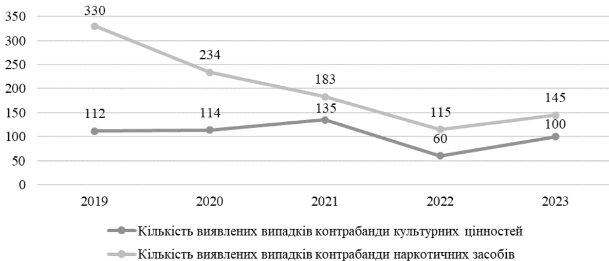
Рис. 1. Кількість випадків контрабанди протягом 2019 - 2023 років

Цей аналіз дозволить визначити динаміку змін у кількості виявлених випадків контрабанди, що може свідчити про ефективність або неефективність заходів, вжитих митними органами.