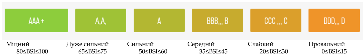
Рис. 2. Класифікація брендів за Індексом міцності бренду (BSI) [5]

Представники Brand Finance стверджують, що «В умовах, коли західний світ бачить реальну кризу лідерства по обидва боки Атлантики, що розвивається світ надолужує згаяне. Сміливі, моторніші, все більш інноваційні бренди африканських, близькосхідних, азіатських і латиноамериканських країн стрімко йдуть вперед із запаморочливою швидкістю, готові до подальшого зростання в найближчі роки» [5].