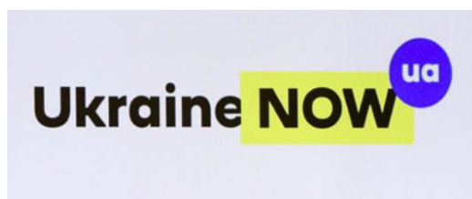
Рис.4. Бренд «Україна Зараз (Ukraine NOW UA)»

У 2015 році в рамках Стратегії сталого розвитку «Україна - 2020» було передбачено створення національного бренду України. У 2018 році цей бренд був створений і отримав назву «Україна Зараз (Ukraine NOW UA)». Над його розробкою працювали українські експерти-працівники рекламного агентства Banda Agency та команда уряду. Представник уряду заявив, що «ми робили добрий крок, аби почати брендувати нашу країну. Хочу подякувати всім за роботу» та доручено «Міністерству інформаційної політики зареєструвати цей знак і розробити стандарт його використання» [9].