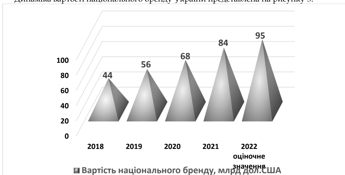
Рис. 3. Динаміка вартості національного бренду України, млрд дол.

Динаміка вартості національного бренду України представлена на рисунку 3.