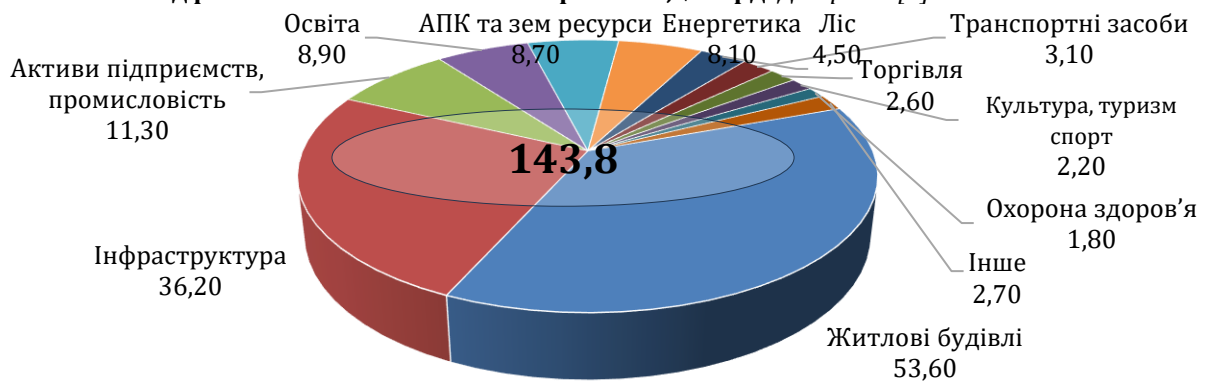
Рис. 2. Структура оціночних втрат економіки України від російського військового вторгнення, $ млрд. Джерело: [5]

Ці втрати призвели до різкого падіння економіки України та погіршення добробуту населення. Відновлення української економіки після війни буде тривалим і складним процесом.