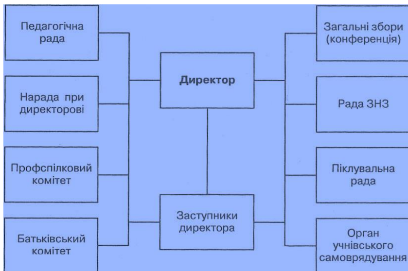
Сх.1. Організаційна структура управління закладом загальної середньої освіти

Організаційну структуру управління визначають як сукупність органів, між якими розподілені повноваження і відповідальність за виконання управлінських функцій. Управління ЗЗСО здійснює його директор. (див. Схему 1)