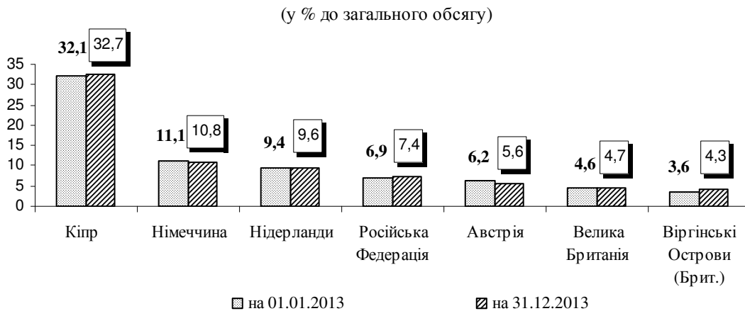
Рис. 3. Розподіл прямих інвестицій (акціонерного капіталу) в Україну за основними країнами-інвесторами

Нагадаємо, за даними Держстату, в 2012 році в економіку України іноземні інвестори вклали $6,013 млрд