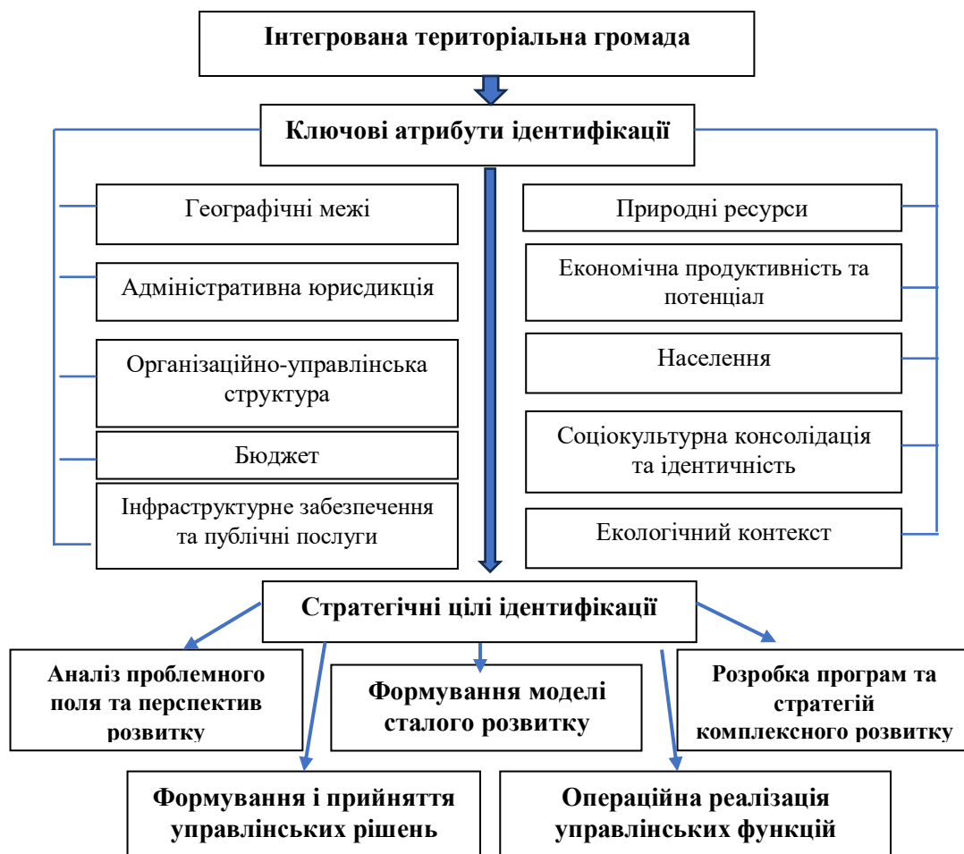
Рис.1.1. Ідентифікація системних характеристик та компонентів дефініції «територіальна громада»