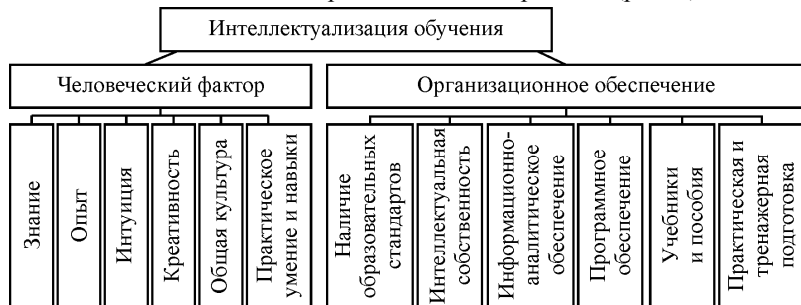
Рис. 2. Структуризация компонентов, обеспечивающих интеллектуализацию обучения

Согласно [8], интеллектуальный капитал – это система полученных знаний, использование которых приносит дополнительный доход при его рациональном потреблении в виде набора компетенций и практических навыков. Он включает в себя такие виды ресурсов, которые не поддаются традиционным оценкам состояния обучаемого, а порождаются знаниями персонала. В связи с этим автором настоящей статьи предлагается разделить получение компетенций при овладении профессиональными качествами курсантов специальности эксплуатация судовых энергетических установок на человеческий фактор и организационное обеспечение образовательного процесса (рис. 2).