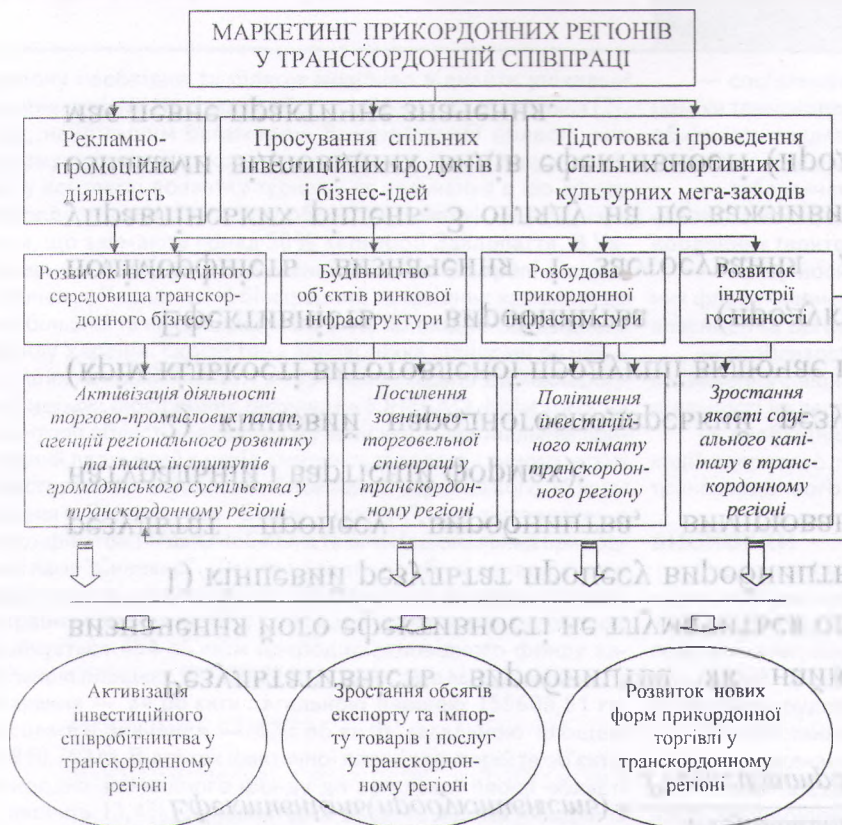
Рис. 1. Маркетинговий інструментарій механізму становлення та розвитку зовнішньоекономічних зв'язків у транскордонному регіоні