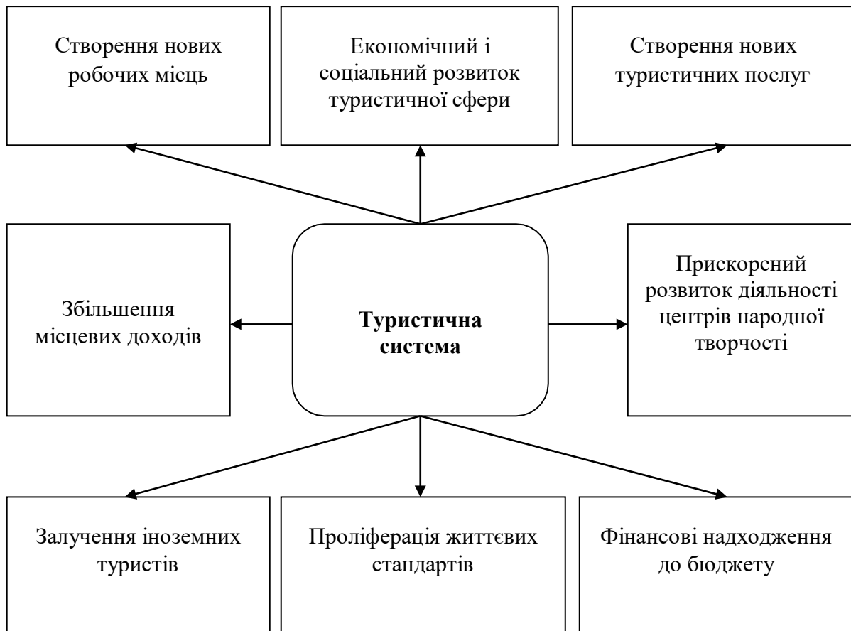
Рис. 1. Соціально-економічні чинники розвитку туристичної системи

Ринок туристичних послуг характеризується своїми функціями, виконання яких передбачає досягнення основних цілей його розвитку (рис. 2).