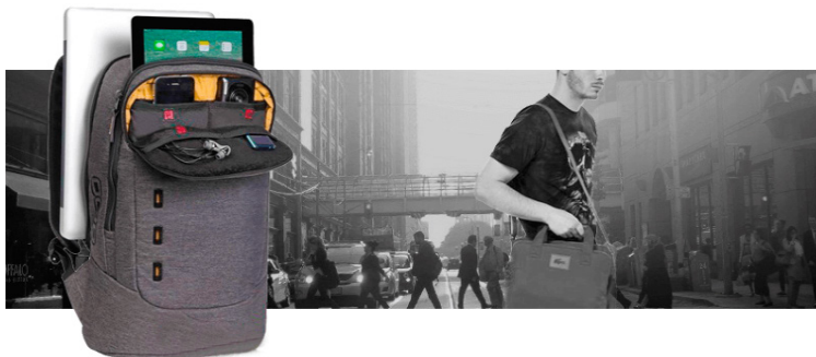
Рис. 6. Рюкзаки для ноутбуків

Рюкзаки для ноутбуків (рис.6). Це набагато зручніше, ніж сумка, адже ваші руки завжди будуть вільні. Головна функція такого рюкзака - це доставити ноутбук в цілості й неушкодженості. Спеціальне відділення для ноутбука не повинно дозволити йому бовтатися, а стінки мають бути щільними. Спинка у таких рюкзаках бажано щоб була жорстка, а дно захищене.