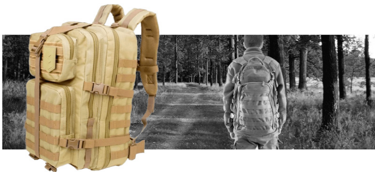
Рис. 5. Тактичні рюкзаки

Рюкзаки для ноутбуків (рис.6). Це набагато зручніше, ніж сумка, адже ваші руки завжди будуть вільні. Головна функція такого рюкзака - це доставити ноутбук в цілості й неушкодженості. Спеціальне відділення для ноутбука не повинно дозволити йому бовтатися, а стінки мають бути щільними. Спинка у таких рюкзаках бажано щоб була жорстка, а дно захищене.