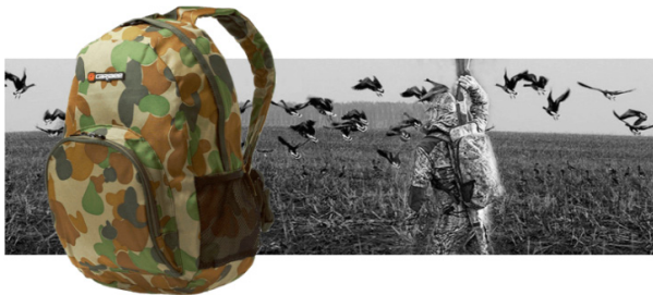
Рис. 7. Рюкзаки для полювання і риболовлі

Сучасна мода диктує свої особливості. Вона дозволяє вибрати те, що найкраще підходить конкретному покупцеві, характеризує його стиль життя. У новому сезоні особливо популярними будуть моделі трикутної форми, рюкзаки-мішки, аксесуари з численними накладними кишеньками тощо (рис.8) [7].