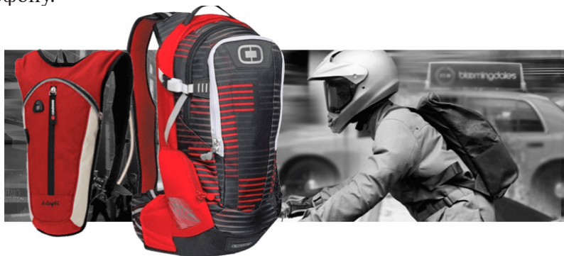
Рис. 4. Велорюкзаки і моторюкзаки

Велорюкзаки і моторюкзаки (рис.4). Веломоделі відрізняються спеціальною вигнутою спинкою, яка забезпечує вентиляцію. Призначаються для розміщення в них аксесуарів і інструментів для велосипеда, питної системи. На таких рюкзаках обов'язково на зовнішній стороні є світловідбивачі вставки. Моторюкзаки функціональні і практичні, у них можна помістити шолом, в деяких навіть є відділення призначене для ноутбука, телефону.