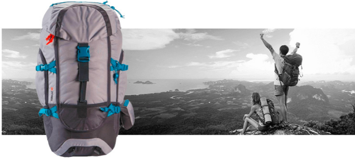
Рис. 1. Туристичний рюкзак

Спортивний рюкзак (рис.2). Такий рюкзак є важливою деталлю образу сучасної людини. Він використовується при походах в секцію, басейн, під час прогулянок на природі. Це зручна альтернатива повсягденній сумці, більш міцна, компактна, містка, легка. Однак при виборі цього рюкзака потрібно враховувати дизайн колір та елементи привабливого зовнішнього вигляду.