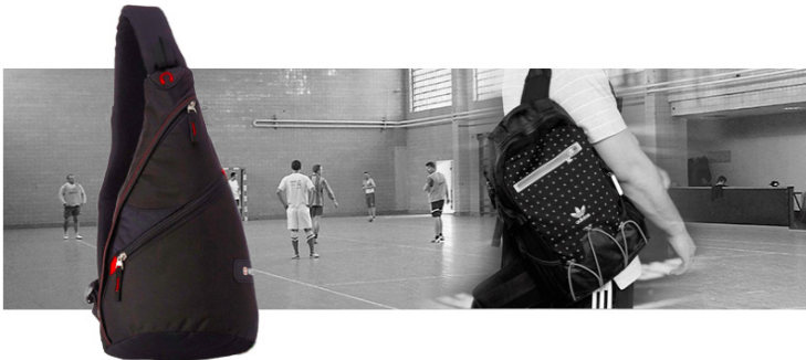
Рис. 2. Спортивний рюкзак

Спортивний рюкзак (рис.2). Такий рюкзак є важливою деталлю образу сучасної людини. Він використовується при походах в секцію, басейн, під час прогулянок на природі. Це зручна альтернатива повсягденній сумці, більш міцна, компактна, містка, легка. Однак при виборі цього рюкзака потрібно враховувати дизайн колір та елементи привабливого зовнішнього вигляду.