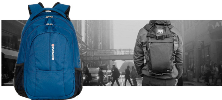
Рис. 3. Міський рюкзак

Велорюкзаки і моторюкзаки (рис.4). Веломоделі відрізняються спеціальною вигнутою спинкою, яка забезпечує вентиляцію. Призначаються для розміщення в них аксесуарів і інструментів для велосипеда, питної системи. На таких рюкзаках обов'язково на зовнішній стороні є світловідбивачі вставки. Моторюкзаки функціональні і практичні, у них можна помістити шолом, в деяких навіть є відділення призначене для ноутбука, телефону.