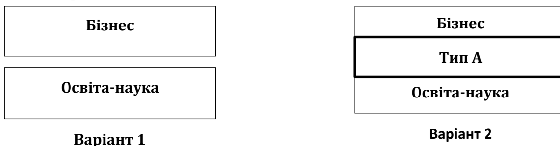
Рис. 1. Варіанти центрів розвитку з позицій оцінки ступеня взаємозв'язку між зонами «Бізнес-Освіта-наука».

Виокремлення територій у яких «кристалізуються» «Бізнес» (сукупність промислових підприємств) та «Освіта-наука» (сукупність навчальних та наукових установ) дозволяють оцінити потенційні можливості цих територій до розвитку (рис. 1).