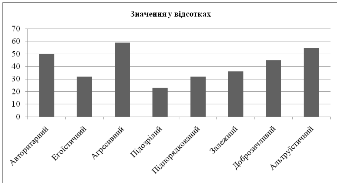
Рис. 2 Типи міжособистісних стосунків у відсотковому значенні.

Найменш вираженим у даної групи досліджуваних є підозрілий тип особистості. Високі показники за даною шкалою спостерігаються у 23% досліджуваних, середнє значення 8,09. Дана шкала характеризується критичністю, замкнутістю та відчуженістю по відношенню до зовнішнього світу. Результати графічно представлені (див. рис. 2.)