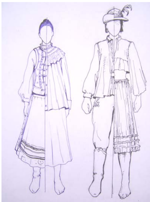
а б Рисунок 5 – Складові угорського костюму Закарпаття а) жіночий; б) чоловічий

середовищі селян Закарпаття. Кінці рукава оздоблювались мереживом білого, а на Виноградівщині жовтого кольору, яке сильно крохмалилось.