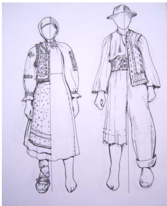
а б Рисунок 3 – Складові костюму долинян Закарпаття а) жіночий; б) чоловічий

Бойківська жіноча сорочка також довгий час зберігала свою архаїчну форму (рис.2). Від Східних Бескидів до Верховини домінує коротка, (сягаюча стегон) сорочка. Її зшивали із трьох або чотирьох частин. Кінці вшитих рукавів та навколо вирізу горловини полотно збирали у дрібненькі складки «р'ями», на які наносилася вишивка виконана у техніці низинки, рідше хрестик. Завдяки цьому досягалась фактурна і надзвичайно багата поверхня полотна. На бойківській жіночій сорочці нагрудний виріз розташований на правій стороні, що сильно відрізняє її від інших українських чи угорських сорочок. Орнаментація та колористика містить багато спільних елементів із гуцульською сорочкою, але вище приведені конструктивні та декоративні засоби різко відрізняють її від інших етносів. На деяких сорочках вишивалися навіть лінії крою.