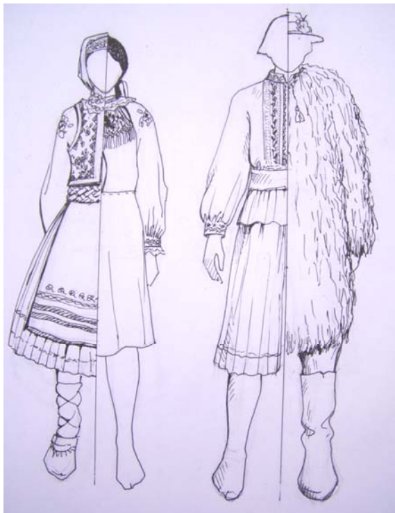
а б Рисунок 4 – Складові костюму лемків Закарпаття а) жіночий; б) чоловічий

жіночих фігур, де між ногами симетрично розташовані два птахи та доповнені деревом життя, що є своєрідною інтерпретацією символу «богині живи» (в угорців – őszanya ).