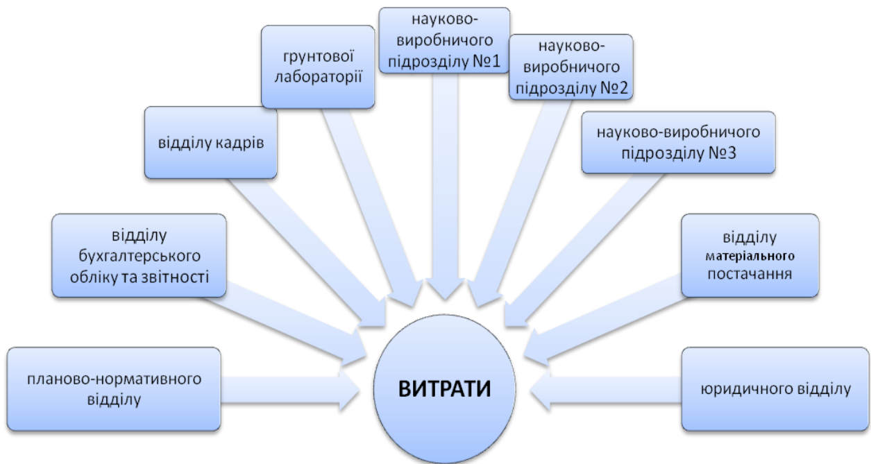
Рис. 2. «Класифікація витрат підприємства за відділами».

Класифікація витрат важлива при визначенні вартості продукції та відповідно при ціноутворенні. Велике значення класифікації витрат в управлінні ними і перш за все для здійснення калькуляції собівартості продукції для різних потреб управління.