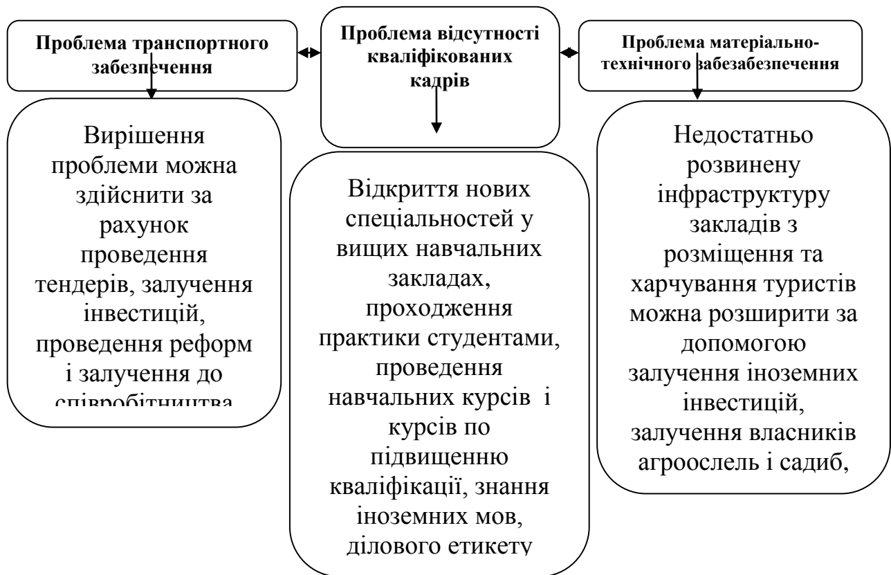
Рис. 4. Шляхи вирішення проблем інфраструктурного забезпечення в Карпатському регіоні

Для розбудови туристичної інфраструктури Карпатського туристичного району важливим є дослідження надходження інвестицій. Інвестиційні пріоритети тієї чи іншої галузі визначаються здатністю підприємств забезпечити високу і швидку рентабельність інвестицій. З цієї точки зору Карпат, де зосереджений значний рекреаційний потенціал, сприятливі природні та кліматичні умови, необхідна для обслуговування рекреаційної галузі інфраструктура, є дуже перспективним регіоном.