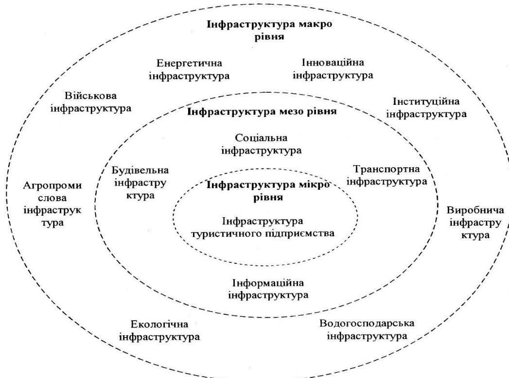
Рис. 2. Схематичне формування туристичної інфраструктури за рівнями вагомості впливу на розвиток сфери туризму

Формування туристичної інфраструктури залежить від економічних, демографічних, соціокультурних, природних, науково-технічних та політико-правових чинників на загальнодержавному та міжнародному рівнях.