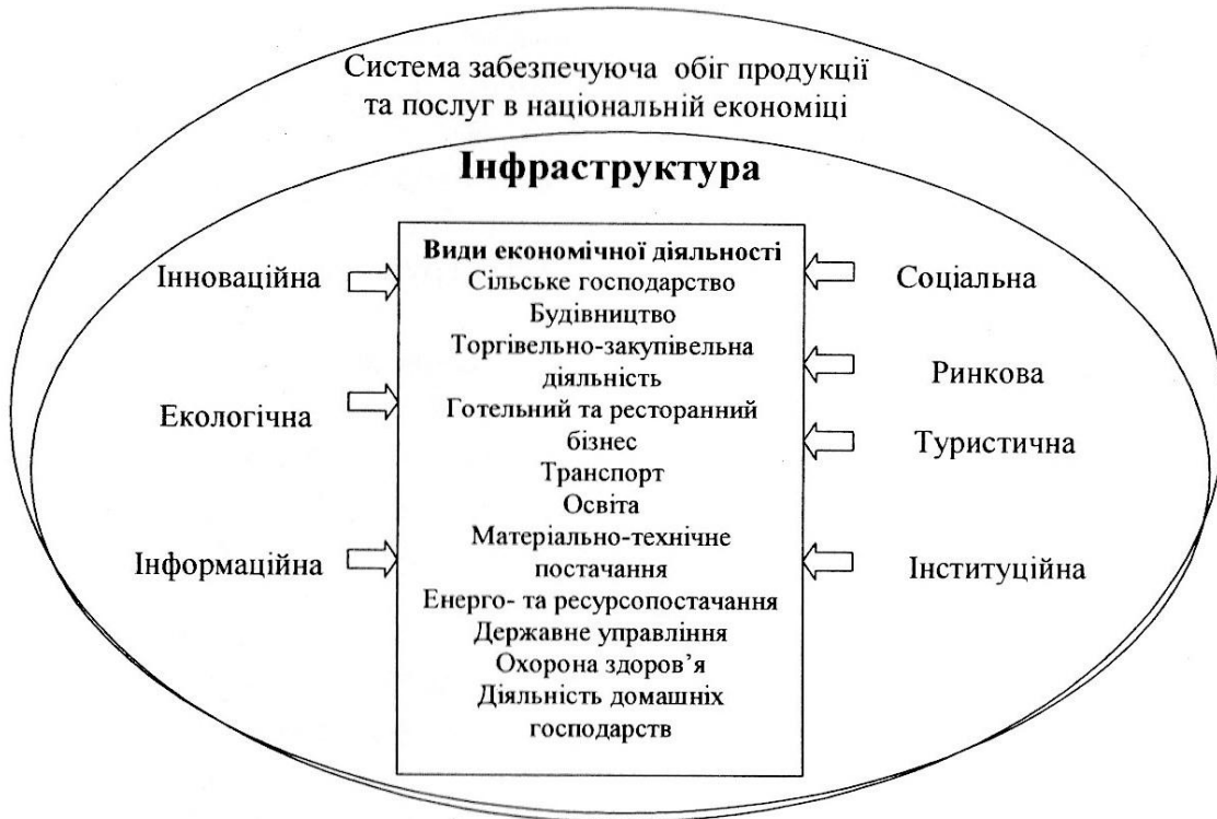
Рис. 1. Елементи, що формують інфраструктуру як цілісну систему

Формування туристичної інфраструктури залежить від економічних, демографічних, соціокультурних, природних, науково-технічних та політико-правових чинників на загальнодержавному та міжнародному рівнях.