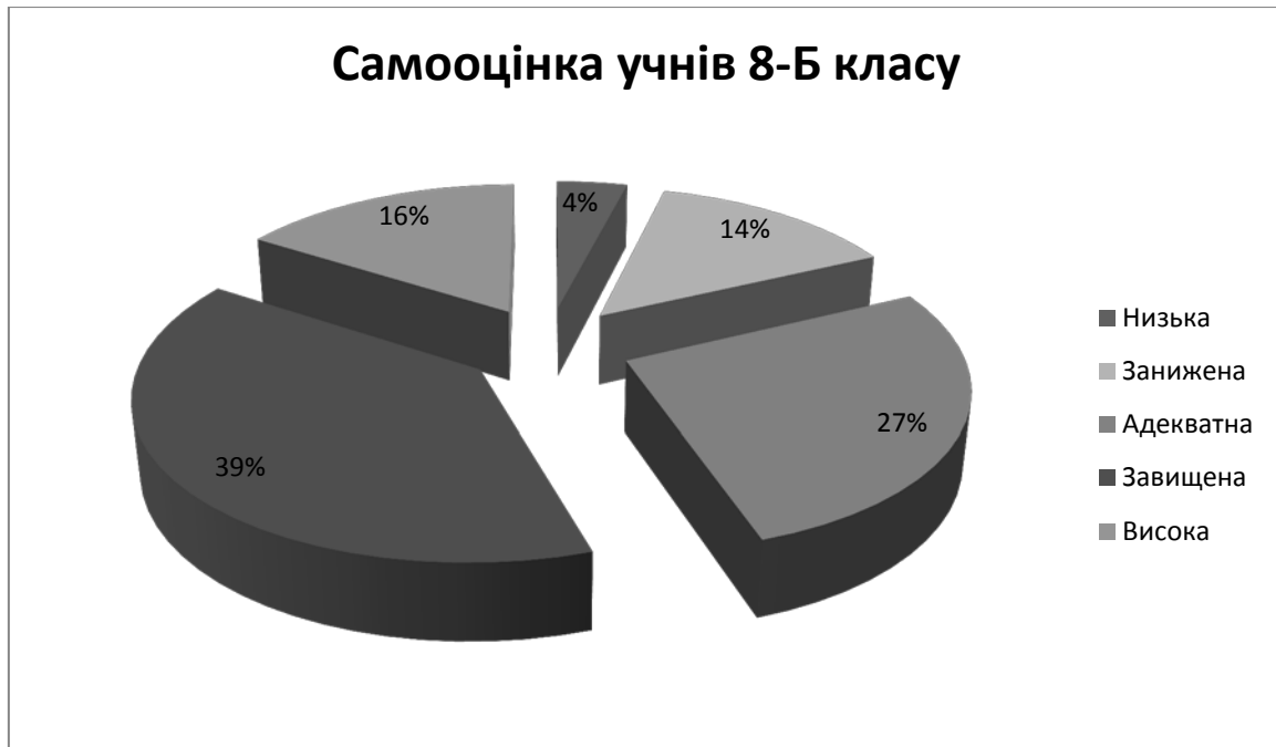
Рис. 2 Рівні самооцінки у досліджуваних учнів

Опитувані оцінювались за рівнем вираженості показників самооцінки і були розділені на 5 груп: низький рівень самооцінки характеризували показники від -1 до 0, занижену самооцінку мали учні, у яких рівень самооцінки коливався від 0,01 до 0,3, адекватна самооцінка відповідала показникам 0,31-0,6, завищена – 0,61-0,85 і високу самооцінку характеризували показники від 0,86 до 1 (рис. 2).