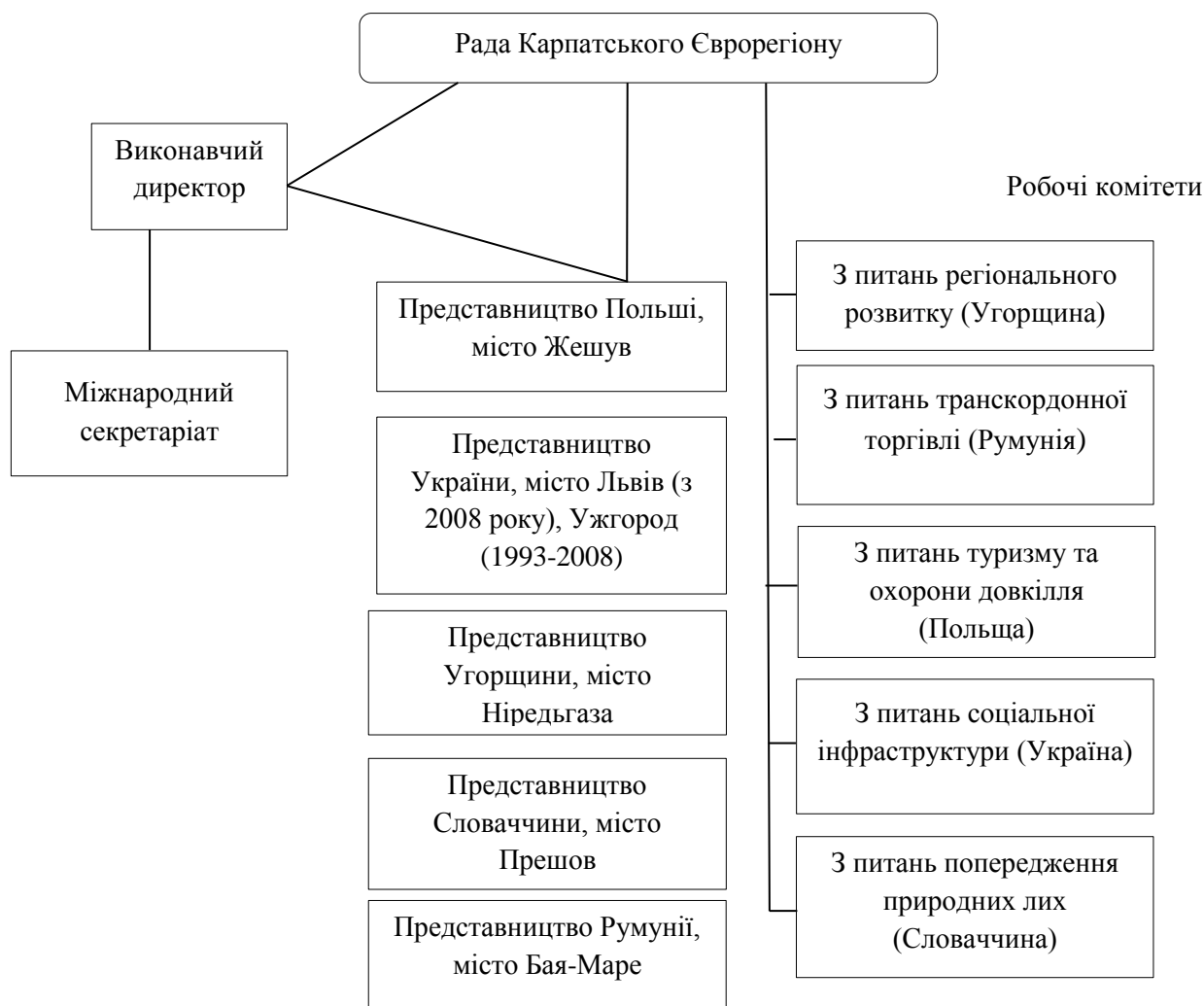
Рисунок 2 – Організаційна структура Асоціації «Карпатський Єврорегіон» *узагальнено на основі [1, с. 120; 8]

В цілому виявлено, що ОСУ Карпатського Єврорегіону належить до децентралізованого одиничного багатовекторного управління. Проте набирає актуальності дослідження більш детальної ефективності управління Карпатським Єврорегіоном. Для цього необхідно вивчити національні особливості (спробуємо на українському прикладі).