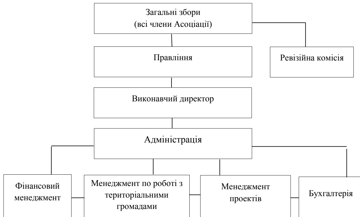
Рисунок 3 – Організаційна структура Асоціації «Єврорегіон Карпати – Україна» *узагальнено на основі [10]

ОСУ Асоціації органів місцевого самоврядування «Єврорегіон Карпати – Україна» відображено на рис. 3.