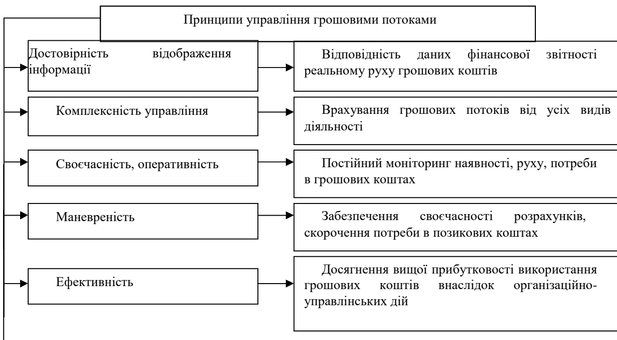
Рис. 1. Принципи та управління грошовими потоками на підприємстві

Найважливішою передумовою здійснення оптимізації грошових потоків є вивчення факторів, що впливають на їхні обсяги і характер формування в часі. Система основних факторів, що впливають на формування грошових потоків підприємства, приведена на рисунку 2.