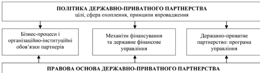
Рис. 1. Основа державно-приватного партнерства [15]

Економічний зміст та основа державно-приватного партнерства відображені в Огляді Міжнародного банку реконструкції та розвитку [15] та має такий вигляд (рис. 1).