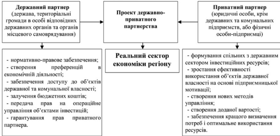
Рис. 2. Організаційний механізм державно-приватного партнерства (розробка авторів)

Механізм державно-приватного партнерства набирає все більшої популярності у всьому світі. В залежності від участі та ролі держави у цьому механізмі, на теоретичному рівні можна виділити такі типи державно-приватного партнерства: держава – замовник; держава – рівноправний партнер; держава – гарант. Запропоновані типи моделей державно-приватного партнерства ґрунтуються на визначенні як пріоритетної ролі держави.