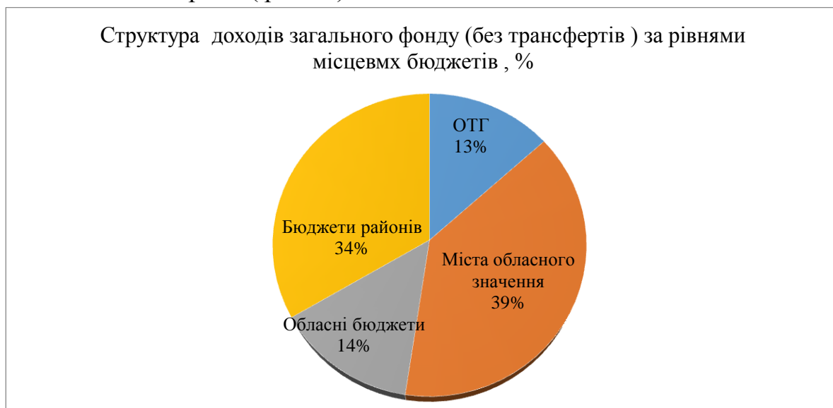
Рис.2. Структура доходів загального фонду (без трансфертів) за рівнями місцевих бюджетів,% [6]

У 2019 році прямі міжбюджетні відносини з державним бюджетом мають 806 об'єднаних територіальних громад (з урахуванням 24 міст обласного значення, в яких відбулося приєднання). За січень-березень 2019 року доходи загального фонду ОТГ (без урахування трансфертів з державного бюджету) склали 8,1 млрд грн, що становить 13,3% від загального обсягу доходів усіх місцевих бюджетів України( рис.2 ).