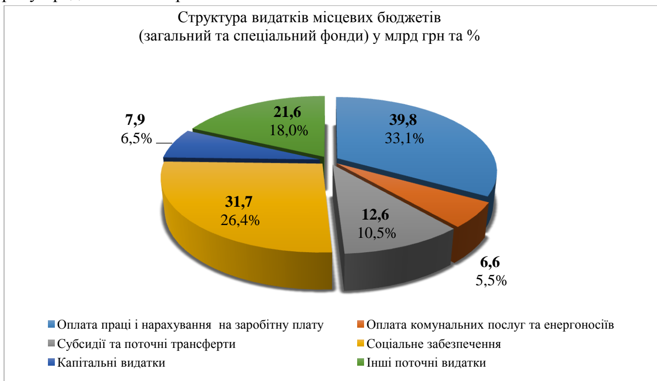
Рис.3. Структура видатків місцевих бюджетів у млрд.грн.[6]

Загальна структура видатків місцевих бюджетів станом на березень 2019 року представлена на рис. 3.