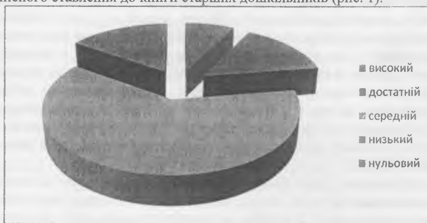
Рис. 1. Результати констатувального дослідження ціннісного ставлення до книги старших дошкільників

За результатами аналізу даних констатувального експерименту на основі визначених критеріїв було виведено загальний рівень розвитку ціннісного ставлення до книги старших дошкільників (рис. 1).