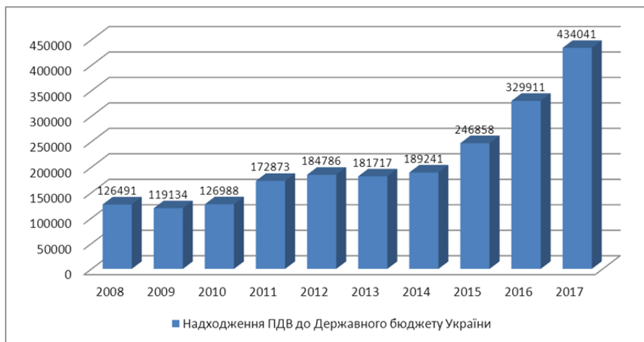
Рис. 2. Динаміка надходжень ПДВ до Державного бюджету за 2008-2017 рр., млн. грн

У 2017 р. надходження ПДВ до Державного бюджету України склали 434041 млн грн., що на 31,6% більше ніж у 2016 р. Динаміка надходжень ПДВ 2008-2017 рр. відображена на рис. 2.