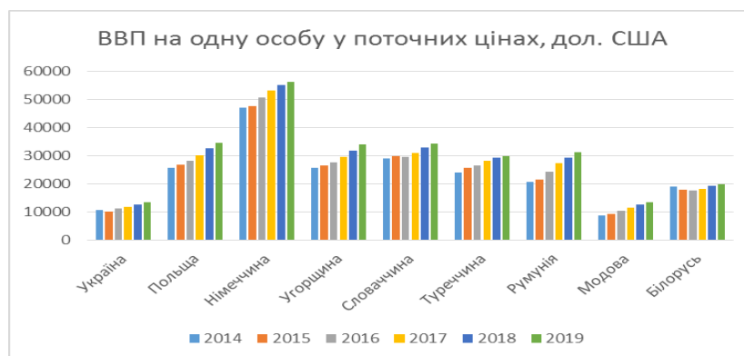
Рис. 2. Динаміка обсягу ВВП на одну особу у поточних цінах у 2014-2019 рр, млрд. дол. США

Зростання обсягу ВВП забезпечує зростання добробуту населення, створює можливості для розвитку підприємств та виробництва, сприяє підвищенню конкурентоспроможності країни на світовій арені. Тому політика урядів багатьох країн спрямована на стимулювання темпів економічного зростання. Водночас динаміка обсягу ВВП на одну особу в Україні значно відстає як від європейських країн, так і країн колишнього Радянського Союзу (див. рис. 2).