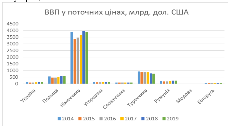
Рис. 1. Динаміка обсягу ВВП у поточних цінах у 2014-2019 рр, млрд. дол. США

Порівняння обсягу ВВП України з іншими країнами дає підстави стверджувати, що за рівнем економічного розвитку наша держава значно відстає від європейських країн, опережуючи лише деякі країни колишнього СРСР (див. рис. 1). Економіка України дуже чутлива та вразлива до зовнішніх шоків, коливань на світових фінансових ринках, а це означає, що більшість позитивних і негативних явищ зовнішнього світу буде «імпортуватися» в нашу країну з відповідними наслідками. А отже, адекватною має бути і економічна політика, спрямована на мінімізацію втрат і максимізацію вигоди від нашої участі в світовому процесі.