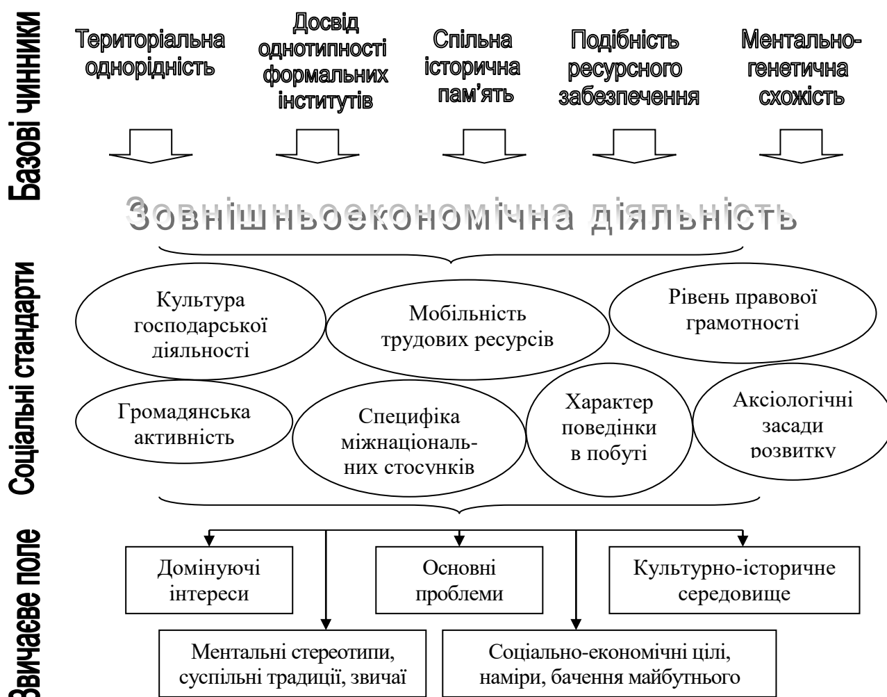
Рис. 3. Чинники розвитку та складові інституційно-звичаєвого середовища транскордонного регіону.

транскордонному просторі, а також базових чинників прямого та опосередкованого впливу на них (рис. 3).